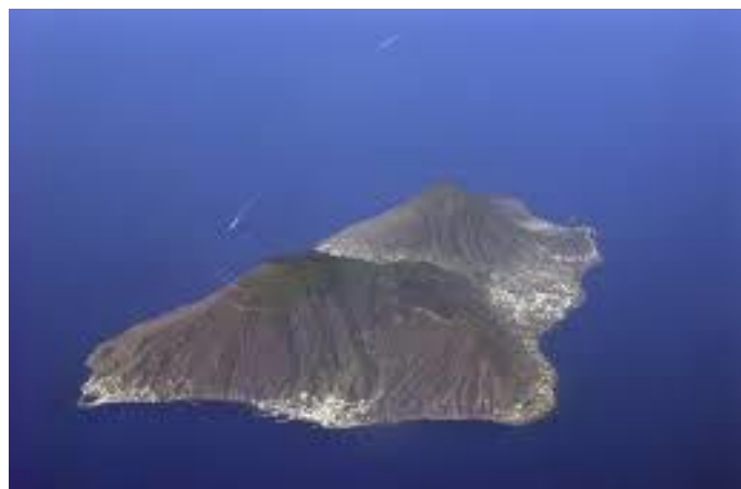
Zisola di Salina

FORMIA NAPOLI; SALINA; TOUR DI SALINA; SALINA ALICUDI E FILICUDI; LIPARI AL TRAMONTO "WELCOME"; GRAN TOUR DI VULCANO; PANAREA E STROMBOLI; LIPARI ANTICHI CRATERI "GOOD BAY"; LIPARI NAPOLI