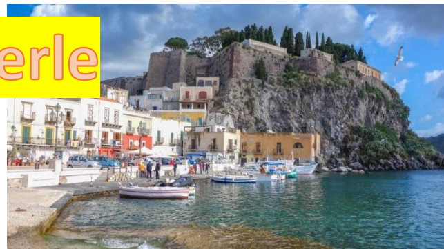
3cittadella di Lipari

Partenza in traghetto SIREMAR notturna con alloggio in cabina interna + Transfert Formia / Napoli da dividere in base ai partecipanti circa 30 €